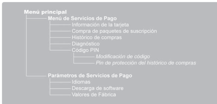
Figura 1. diagrama del menú del dispositivo.